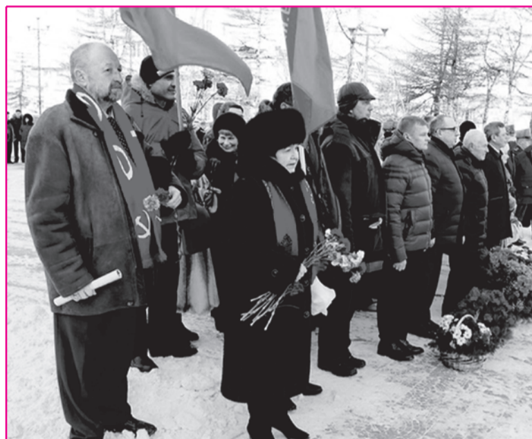
22 февраля состоялся общегородской митинг с возложением цветов к монументу «Узел памяти».

ДЕНЬ КРАСНОЙ АРМИИ И ВОЕННО-МОРСКОГО ФЛОТА В МАГАДАНЕ