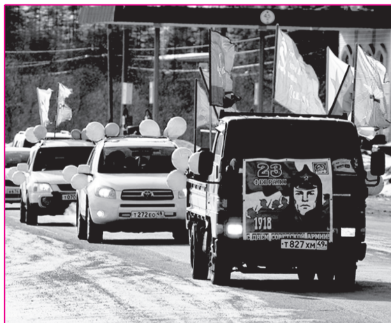
23 февраля коммунисты провели автопробег, проехав по главным улицам города на автомобилях, украшенных флагами разных родов войск, Знаменами Победы, КПРФ, шарами. Из головной машины звучала знакомая и любимая всеми музыка советского времени. Во время коротких остановок в людных точках города коммунисты поздравляли горожан с праздником и раздавали праздничный выпуск газеты «Колымская искра».