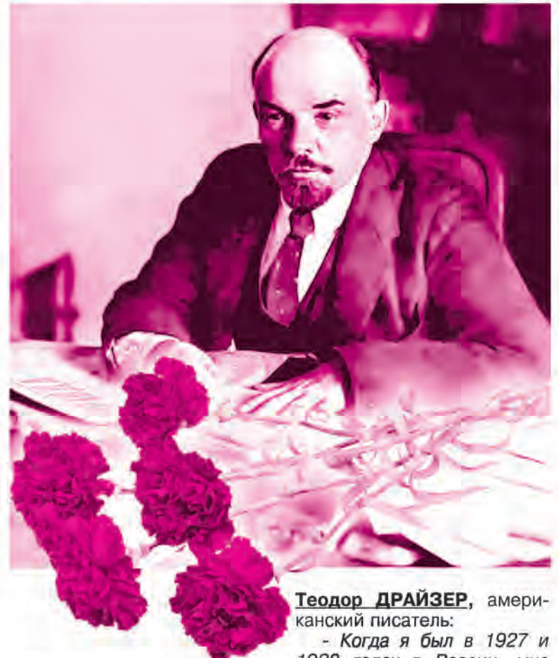
Теодор ДРАЙЗЕР , американский писатель:

Бернард ШОУ , английский драматург: - Если будущее будет таким, каким его предвидел Ленин, тогда мы все можем улыбаться и смотреть в будущее без страха. Однако если эксперимент его будет сорван и кончится неудачей, если мир будет упорствовать в сохранении капиталистического развития, тогда я должен с большой грустью проститься с вами, мои друзья. Я не сомневаюсь, что наступит день, когда в Лондоне будет воздвигнута статуя Ленина рядом со статуей Георга Вашингтона. Могу прибавить,