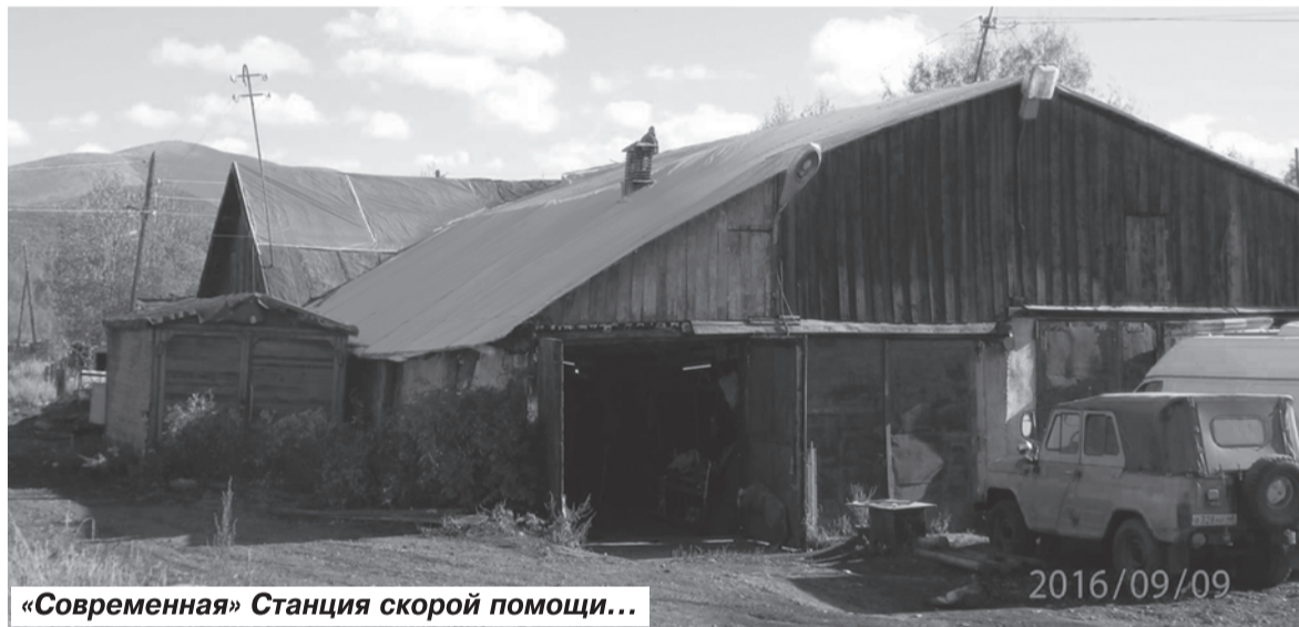
«Современная» Станция скорой помощи...

Поэтому не нужно верить пустым обещаниям «единороссов». К сожалению, ничего к лучшему у нас в стране не меняется во времена тотального засилья в Госдуме, областной Думе, в представительных органах местного самоуправления членов партии «Единая Россия», и не изменится в дальнейшем, если мы с вами не захотим перемен. А для этого нужно 18 сентября прийти на выборы и отдать свои голоса людям и партиям достойным, радеющим за наше население.