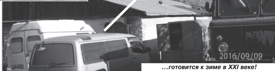
...готовится к зиме в XXI веке!

При этом, несмотря на возможность местного референдума по вопросу главы городского округа, мы вот уже без малого полтора года в судах обжалуем действия Избиркома Магаданской области, связанные с ее отказами в регистрации инициативной группы референдума. Да и наши депутаты - члены фракции «Единая Рос-