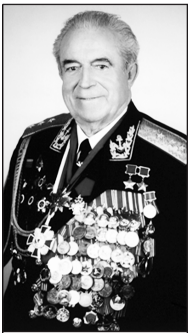
Виталий ПОПКОВ (Одно из последних фото)

Дважды Герой Советского Союза В. И. Попков награжден тремя орденами Ленина, двумя орденами Красного знамени, орденом Александра Невского, тремя орденами Отечественной войны I степени, орденом Отечественной войны II степени, тремя орденами Красной Звезды, орденом «За службу Родине в Вооруженных Силах СССР» III степени, многими медалями. В общей сложности 75 наград (весом 8 кг.). Свою военную карьеру Виталий Попков закончил только в 1989 году.