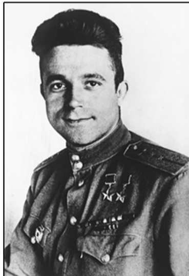
Виталий ПОПКОВ (Фото 1945 года)