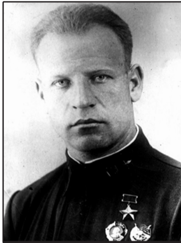
Герой Советского Союза Василий ЗАЙЦЕВ

- Ваш бой - это не просто тактическая победа. Вы доказали, что советская тактика превзошла немецкую, и что наши машины маневренней. Поздравляю! И жду вашего возвращения в строй.