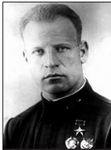
Герой Советского Союза Василий ЗАЙЦЕВ

- Ваш бой - это не просто тактическая победа. Вы доказали, что советская тактика превзошла немецкую, и что наши машины маневренней. Поздравляю! И жду вашего возвращения в строй.