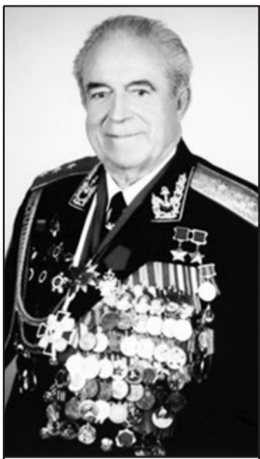
Виталий ПОПКОВ (Одно из последних фото)

Дважды Герой Советского Союза В. И. Попков награжден тремя орденами Ленина, двумя орденами Красного знамени, орденом Александра Невского, тремя орденами Отечественной войны I степени, орденом Отечественной войны II степени, тремя орденами Красной Звезды, орденом «За службу Родине в Вооруженных Силах СССР» III степени, многими медалями. В общей сложности 75 наград (весом 8 кг.). Свою военную карьеру Виталий Попков закончил только в 1989 году.