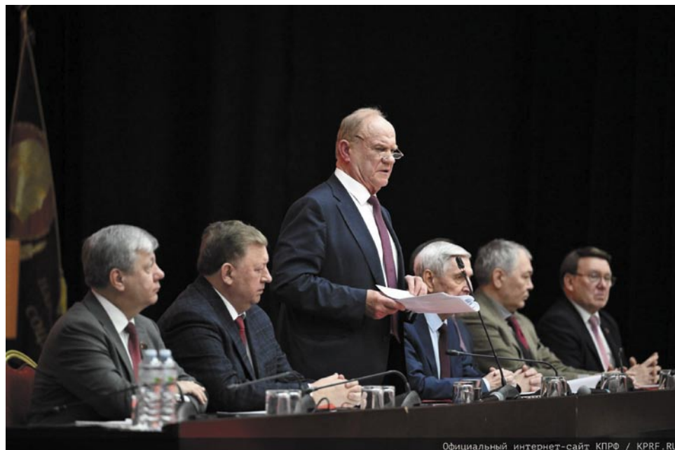
Официальный интернет-сайт КПРФ / KPRF.RU

Товарищи! Чёрные тучи над Россией вновь сгустились. Для движения вперёд требуется концентрация всех сил и ресурсов. А мы всё расхлёбываем последствия горбачевского предательства и ельцинского майдана 1991–1993 годов. По этой причине Москва крайне скована в своём ответе на грозные вызовы. Развал либерального лихолетья не преодолен. Его и не преодолеть без смены системы, без реализации нового курса. В 1990 году в России действовало более 36 тысяч крупных предприятий. В результате приватизации и реформ, на 2020 год их осталось 6 тысяч. Захват олигархами стратегических отраслей промышленности обескровил государственный бюджет. Сектор высоких технологий пережил тяжёлый погром. Убивались научные и образовательные достижения советской эпохи. Экономика, наука, социальная сфера, вооружённые силы были посажены на голодный паёк. Зато разгулялись «новые собственники». Они изобретательно выводили активы за границу, строили дворцы и яхты. Бо-