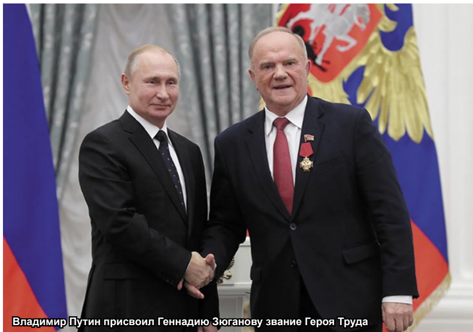
Владимир Путин присвоил Геннадию Зюганову звание Героя Труда

Это удивительно, как в течение двух дней все ведущие федеральные телеканалы тепло поздравляли лидера КПРФ Геннадия Зюганова. Первый канал, Россия 1, НТВ, ТВ Центр, Рен ТВ по несколько раз в день освещали в своих новостных выпусках юбилей Геннадия Андреевича. Представить себе такое еще лет пятнадцать-двадцать назад, не говоря уже о «святых» для вдовы Б. Ельцина 1990-х, когда коммунистов все либеральные СМИ обзывали «красно-коричневыми», просто невозможно. И даже десять лет назад, когда началась Русская Весна, затем аккуратно сведенная только к возвращению Крыма и не более, что-то не припоминается подобных славословий со стороны официальных СМИ в адрес главы КПРФ. Что же изменилось в обществе, в Государстве Российском, почему юбилей руководителя пусть парламентской, но все же оппозиционной партии так повсеместно был отмечен, не говоря уже про то, что Владимир Путин присвоил звание Героя Труда Геннадию Зюганову.