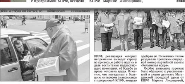
КПРФ, реализация которых непременно выведет страну из кризиса, о работе партии в деле воспитания подрастающего поколения, ее борьбе за права человека труда. Отметим, что магаданцы с большим интересом знакомились с программой КПРФ, всецело одобряя ее. Пикетчики также раздавали прохожим очередную номер партийной газеты «Колымская искра».