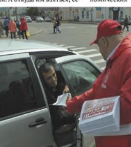
КПРФ, реализация которых непременно выведет страну из кризиса, о работе партии в деле воспитания подрастающего поколения, ее борьбе за права человека труда. Отметим, что магаданцы с большим интересом знакомились с программой КПРФ, всецело одобряя ее. Пикетчики также раздавали прохожим очередную номер партийной газеты «Колымская искра».

КПРФ постоянно указывает властям на необходимость настоящего, а не показного патристического воспитания. Здесь не должно быть двойных стандартов. В условиях СВО стране нужны патриоты среди молодежи. А откуда им взяться, если до сих пор стоит Ельцин-центр, памятник бригадному генералу Краснову и т.п.?