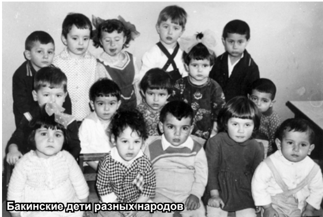
Бакинские дети разных народов

В детстве был такой случай. Мне уже исполнилось лет десять-одиннадцать, а младшему брату, соответственно, лет шесть или семь. Время на дворе – вторая половина семидесятых. Мы уже переехали из центра Баку в новый микрорайон, а там были одни новостройки, куда переселяли людей из бараков и частных развалюх на окраине. И среди соседских детей немало оказалось азербайджаноязычных ребят. Нет, по-русски они говорили, но с сильным акцентом, потому что дома больше на азербайджанском, чем на русском общались с родителями. Были среди соседей и русские, и азербайджанцы, и армяне, и евреи, и лезгины, и татары, и грузины, и курды, и талыши, и таты. А русский был у нас языком межнационального общения. И в школе, и во дворе.