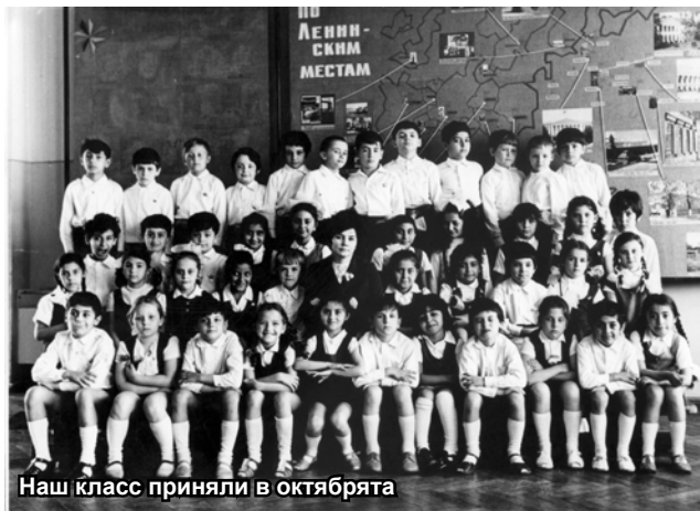
Наш класс приняли в октябрята

Я на всю жизнь запомнил слова того соседского па-