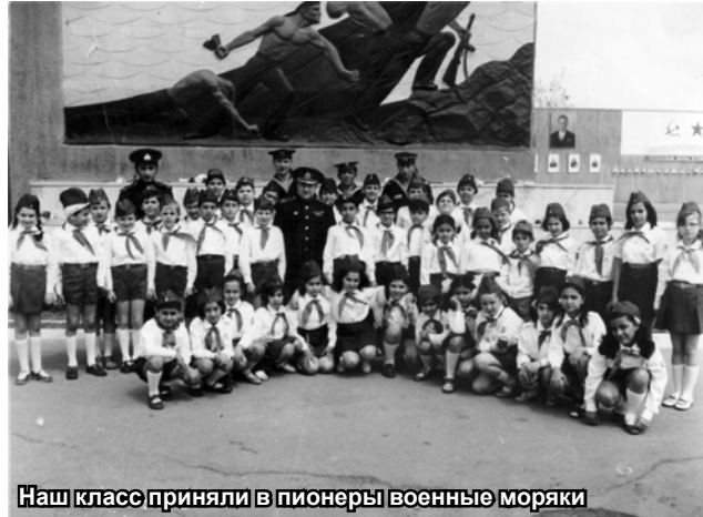
Наш класс приняли в пионеры военные моряки

победителей фашизма. Им важнее оказались «кружевные трусики и зарплаты, как в Евросоюзе». Причем, не как вознаграждение за достойный труд, а как подачка лакею, как вэлфер – пособие безработному. Их идеал – лежать на завалинке, а им в рот, чтобы сами собой, обмазавшись сметаной, залетали бесплатные вареники да галушки. Вот почему в России называют Украину – Страной 404, несостоявшимся государством. Где политическое украинство изначально строилось на противопоставлении русскости – своей природе, общей с жителями России, Белоруссии, да и других постсоветских республик, таких, как Азербайджан, где не только сохранились русские школы, журналы, газеты, книги, телепрограммы, само общение на русском языке, но и поэзия Пушкина, Лермонтова, служившего на Кавказе, Есенина, гостившего в Баку, там бережно передается из поколения в поколение. В начале 2000-х в Баку поставили памятнику Александру Сергеевичу Пушкину, хотя