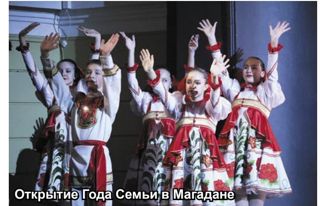
Открытие Года Семьи в Магадане

Плачевное состояние с демографией и в Молдавии. Будучи Молдавской ССР, республика насчитывала 4,3 млн человек населения. Сейчас в суверенной Молдове проживает менее 2,6 млн человек (убыль в 40%). Однако в случае с Молдавией нужно учитывать разницу между наличным