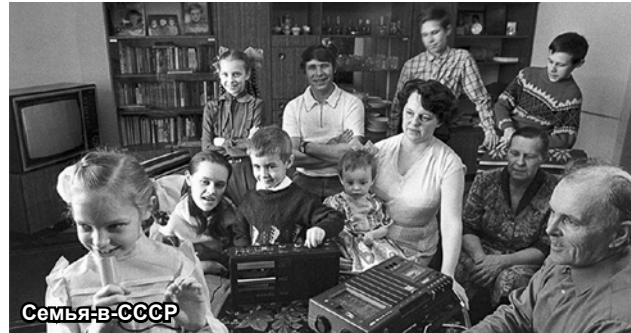
Семья в СССР

Украина здесь тоже не исключение. Наряду с плачевными экономическими показателями там фиксируется ежегодная убыль населения. В УССР в 1991 году проживало около 52 млн. человек. Сегодня этот показатель достигает отметки лишь в 41 млн (минус 20% за 30 лет). Согласно данным украинского Госстата в 2021 г., за шесть месяцев уровень смертности в стране вырос на 21,6% по сравнению с аналогичным периодом 2020 года. Население Украины лишь за 2021 год сократилось на 349 тысяч человек, а эмигрировало из страны 600 тыс. За два года, прошедшие после начала Россией Специальной военной операции по защите населения Донбасса, с двумя основными целями: демилитаризация и денацификация Украины, население этой некогда процветавшей советской республики уменьшилось еще больше. По некоторым оценкам истинное население Украины сегодня не превышает 25 млн.