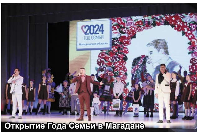
Открытие Года Семьи в Магадане

Начавшийся в России Год семьи, объявленный президентом России Владимиром Путиным, безусловно, важная веха в развитии нашей страны. Демографические проблемы, которые испытывает не только наша Родина и другие республики на постсоветском пространстве, а также европейские государства, и другие промышленно развитые страны, это хороший повод рассмотреть историю роста населения в СССР за все время его существования, а также задуматься о превосходстве социализма над капитализмом и очевидных преимуществах организованного планового хозяйствования в сравнении с «рыночной экономикой» монополистических транснациональных корпораций, нацеленных, прежде всего, на извлечение выгоды при условии хищнической эксплуатации ресурсов и нищающего населения стран третьего мира.