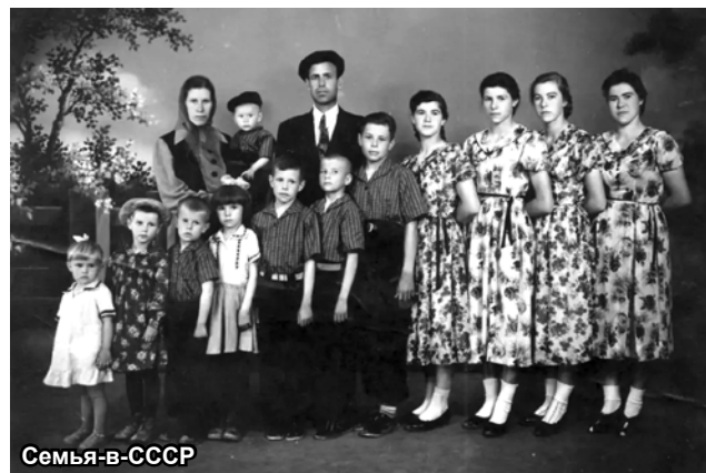
Семья в СССР

Я считаю знаменитую теорию «стакана воды» совершенно не марксистской и сверх того противобщественной. В половой жизни проявляется не только данное природой, но и привнесенное культурой, будь оно возвышенно или низко. Энгельс в «Происхождении семьи» указал на то, как важно, чтобы половая любовь развилась и утончилась. Отношения между полами не являются просто выражением игры между общественной экономикой и физической потребностью. Было бы не марксизмом, а рационализмом стремиться свести непосредственно к экономическому базису общества