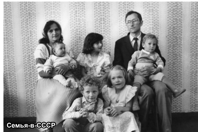
Семья в СССР

Как коммунист, я не питаю ни малейшей симпатии к теории «стакана воды», хотя бы на ней и красовалась этикетка «освобожденная любовь»... Коммунизм должен нести с собой не аскетизм, а жизнерадостность и бодрость, вызванную также и полнотой любовной жизни».