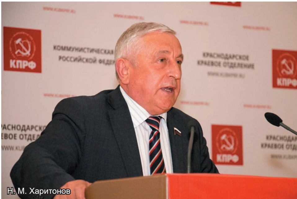
Н. М. Харитонов

НА ПРЕДСТОЯЩИХ ВЫБОРАХ ПРЕЗИДЕНТА РФ КОММУНИСТЫ ВЫДВИНУЛИ КАНДИДАТОМ ОТ КПРФ НИКОЛАЯ МИХАЙЛОВИЧА ХАРИТОНОВА