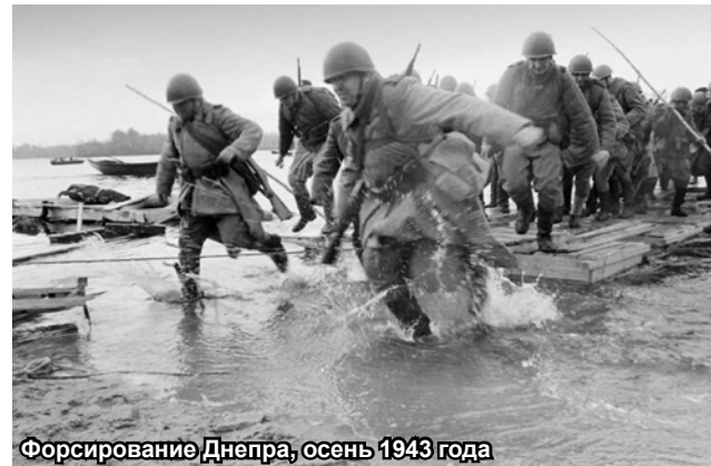
Форсирование Днепра, осень 1943 года

В ходе операции по освобождению столицы советской Украины Красная Армия потеряла убитыми около 6500 человек, и более 24 000 были ранены. Также были повреждены или уничтожены 270 танков и самоходок, более 100 орудий и минометов и 125 самолетов. За 800 дней оккупации гитлеровцы только в Бабьем Яру уничтожили 150 из 400 тысяч киевлян. Еще 100 тысяч угнали в рабство. Сражение за Киев называют еще битвой в дыму. Перед отступлением все мосты через Днепр немцы взорвали, вывели из строя водопровод и канализацию. Город был выжжен дотла. Киевская наступательная операция продолжалась две недели.