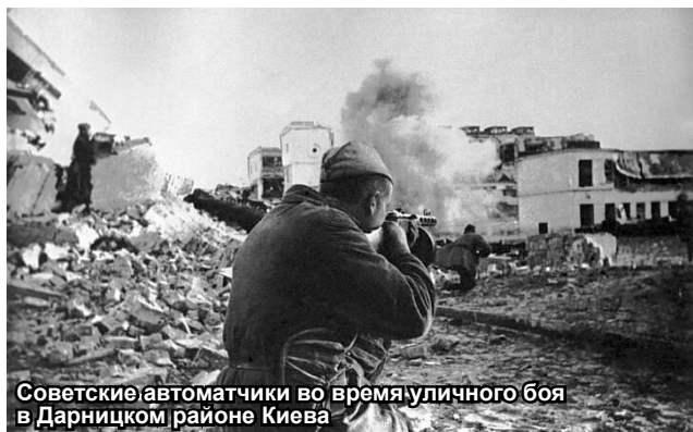
Советские автоматчики во время уличного боя в Дарницком районе Киева

Немецкие войска не прочувствовали на себе такой мощи артиллерийского огня, как в страшную для них ночь с 5 на 6 ноября 1943 года. Советское командование сосредоточило до 350 орудий на одном километре фронта. Такая огневая мощь Красной армии понадобится лишь в 1945-м, во время Берлинской операции. А 80 лет назад перед наступающими частями РККА, на правом, высоком берегу Днепра был Киев. Наступать на столицу Украинской Советской Социалистической Республики планировалось с двух плацдармов – южного Букринского и северного Лютежского. Как полагали фашисты, основным у советского командования считалось южное, но в течение всего только одной ночи, в обстановке строжайшей секретности, были перебро-