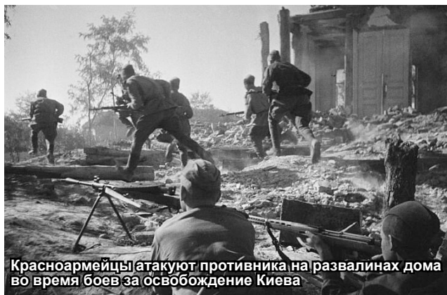
Красноармейцы атакуют противника на развалинах дома во время боев за освобождение Киева

А сегодня и на протяжении уже без малого десяти лет нацизм стал главенствующей идеологией Украины, вот почему российские солдаты снова воюют за освобождение Киева от нацистов