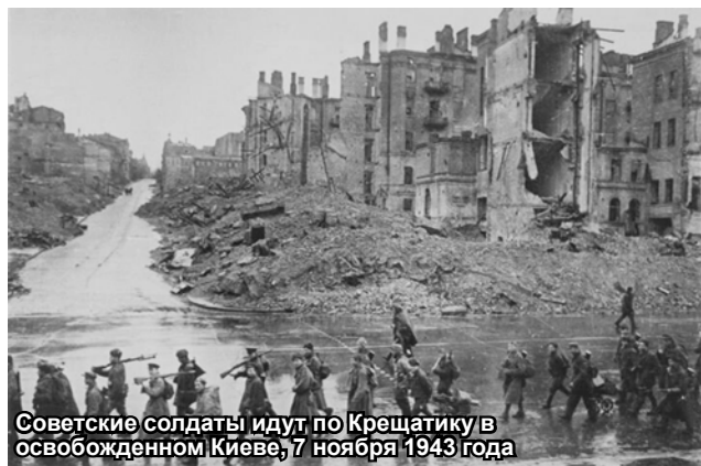
Советские солдаты идут по Крещатику в освобожденном Киеве, 7 ноября 1943 года

В 4 часа утра 6 ноября Киев был взят. Оставшиеся в живых 180 тысяч жителей некогда миллионного города встречали своих освободителей на улицах, которые отступавшие фашисты превратили в руины. Нередко люди задаются вопросом, почему именно 6 ноября был взят Киев? Хотели ли его взять непременно к празднику Великой Октябрьской Революции? Но в архивах нет никаких документов, говорящих о том, что необходимо освободить одну из древних столиц нашей Родины именно к 7 ноября. На самом деле, в приказе было