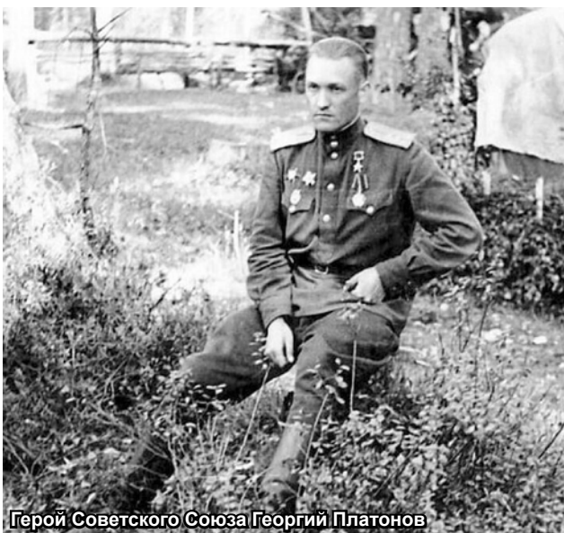
Герой Советского Союза Георгий Платонов

Сегодня нам снова приходится сражаться с извечным геополитическим противником, который на протяжении 800 лет неоднократно приходил на русскую землю с огнем и мечом. Мы сражаемся, как и наши великие деды, против