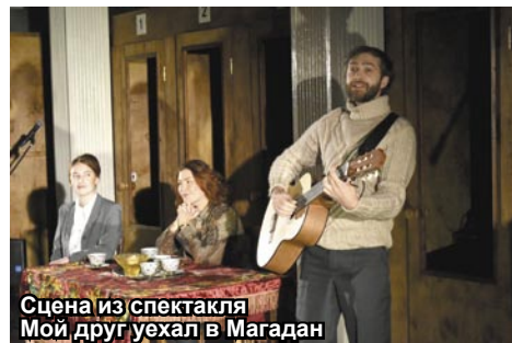
Сцена из спектакля «Мой друг уехал в Магадан»