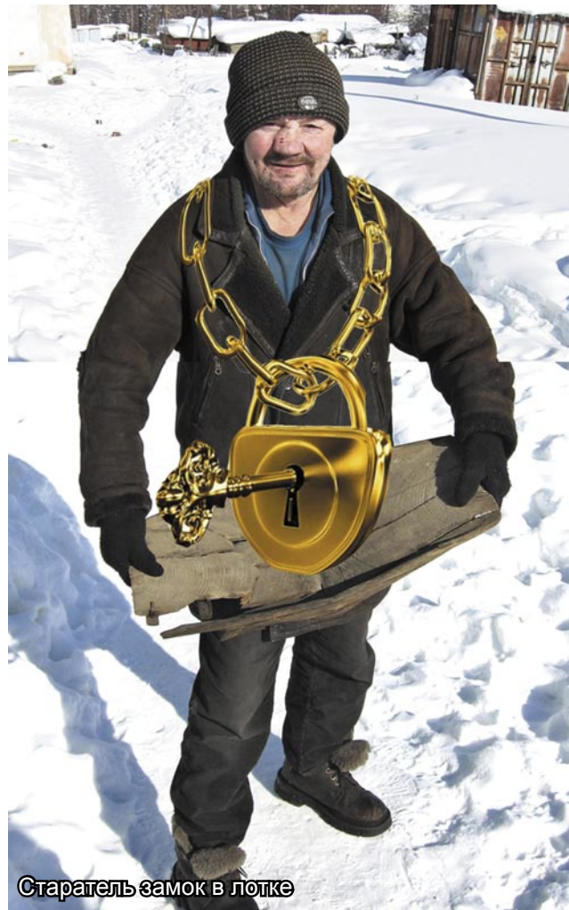
Старатель замок в лотке

Причина всему, на мой взгляд, сказочные, грандиозные проекты, к примеру, строительство железных дорог, вместо внятной экономической политики развития конкретной территории. Президент Российской Федерации в своём послании большое внимание уделял территориям с моно экономикой, и требовал от чиновников всех «мас-тей» конкретных предложений по их развитию, дабы не повторять плачевный опыт моно городов, в которых деятельность администраций привела к социальному взрыву населения.