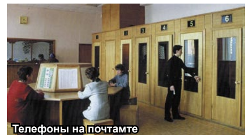
Телефоны на почтамте