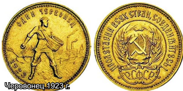
Червонец 1923 г.

«и за исключением россыпного золота, добываемого индивидуальными предпринимателями на основании лицензии на пользование недрами на участках недр, которые в соответствии со статьей 19.2 Закона Российской Федерации «О недрах» в количественном и качественном отношении не являются объектами промышленной разработки».