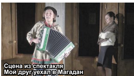
Сцена из спектакля «Мой друг уехал в Магадан»

сидя в аэропорту в Москве. Он ожидал рейса в Одессу, но по погодным условиям вылет туда был отменен. И в это время диктор по громкой связи объявила открытым рейс на Магадан. Высоцкий