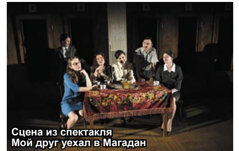
Сцена из спектакля «Мой друг уехал в Магадан»