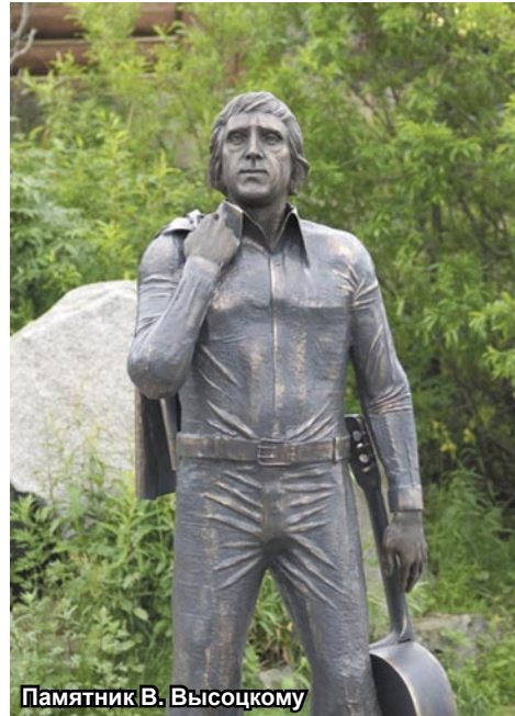
Памятник В. Высоцкому