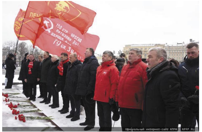
Официальный интернет-сайт КПРФ / КРФР. RU