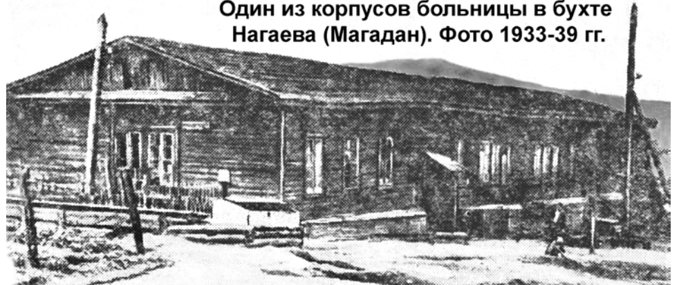
Один из корпусов больницы в бухте Нагаева (Магадан). Фото 1933-39 гг.

Машину коекак утеплили (подогревы тогда еще не делали), дали нам тулупы, и только на второй день после вызова в семь часов утра мы выехали.