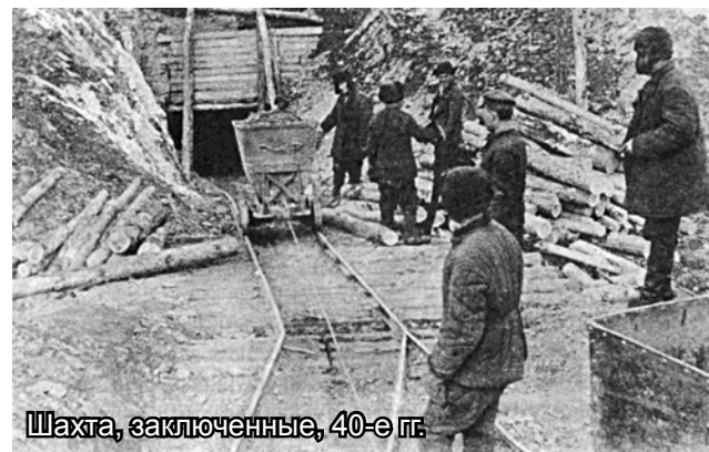
Шахта, заключенные, 40-е гг.