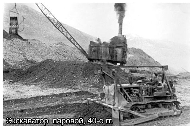
Экскаватор паровой, 40-е гг.