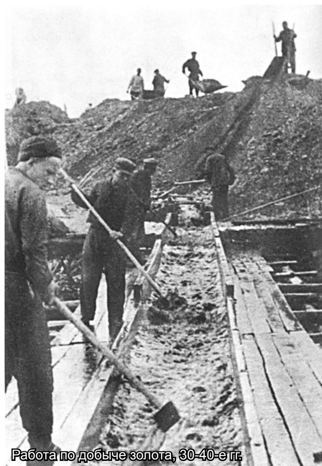
Работа по добыче золота, 30-40-е гг.