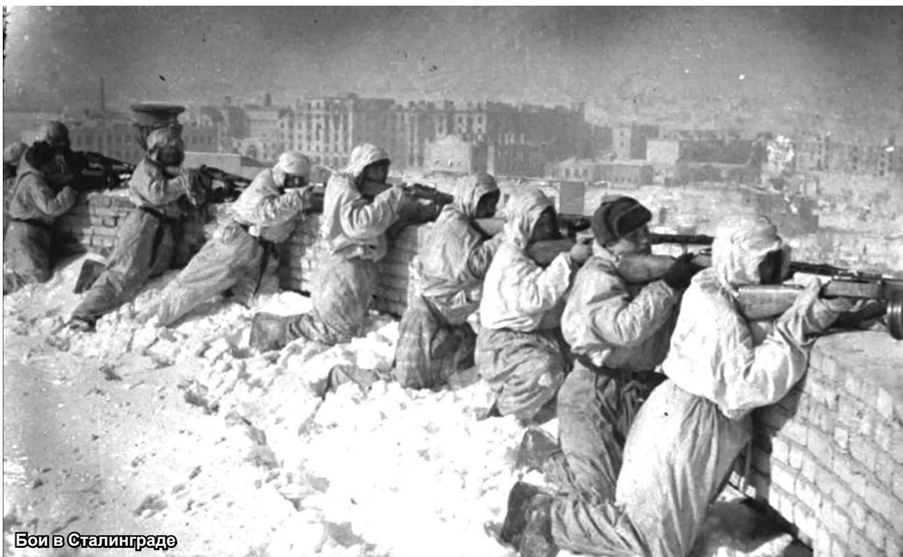
Бои в Сталинграде

шения. Отличилась знаменитая 62-я армия под командованием Василия Ивановича Чуйкова. Я потом служил в этой армии, в составе Группы советских войск в Германии. Она стояла недалеко от Веймара и называлась 8-я гвардейская общевойсковая ордена Ленина армия. Когда Чуйков однажды приехал к нам, дорогу-бетонку от Веймара до Норы, где был штаб, на протяжении всех семи километров немцы вымыли эмульгаторами. Дорога была белая, как скатерть, и пока Чуйков не проехал, никого не пускали. Нашу армию в Германии уважали — немцы здоровались с нами через дорогу. Это была армия героев, ар-