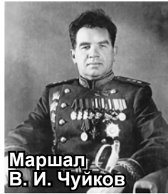
Маршал В. И. Чуйков

Дорогие товарищи и друзья! 2 февраля 2023 года исполнилось 80 лет Сталинградской битве. Это одно из величайших сражений Великой Отечественной войны. На Сталинград Гитлер бросил 6-ю армию вермахте под командованием генерала Паулюса. Свой замысел по захвату города Гитлер планировал осуществить всего за неделю, к 25 июля 1942 г., но она продолжалась 200 дней. К лету 1942-го в городе проживало около 400 тысяч человек. 23 августа 1942 года из Сталинграда было эвакуировано около 100 тысяч человек, но многие не успели эвакуироваться. 23 августа немецкие самолеты стали сильно бомбить город. Было убито более 42 тысяч человек, много домов города были разрушены. Также 23 августа 1942 г. немецкие танки ворвались в Сталинград. Верховный главнокомандующий И. В. Сталин отдал приказ всеми силами удерживать город. Во время Сталинградской битвы особое значение приобрела возвышенность в центре города, обозначенная, как высота 102 или Мамаев курган. Сражение на Мамаевом Кургане имело особо важное значение: с его вершины хорошо просматривалась и простреливалась территория города, переправы через Волгу. Гитлеровцы штурмовали Мамаев Курган по 10-12 раз в день, но, теряя людей и технику, так и не смогли захватить курган. Бои за Мамаев Курган продолжались 140 суток.