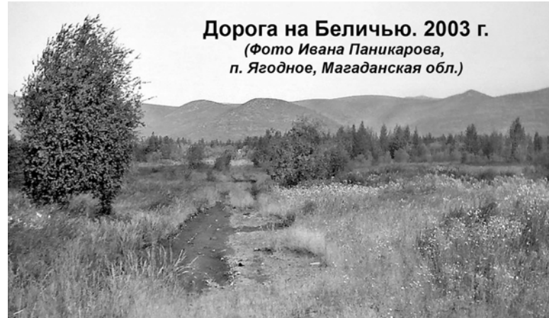
Дорога на Беличью. 2003 г.