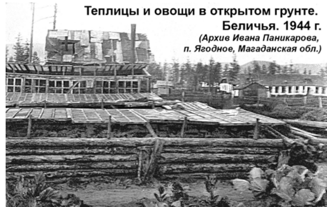
Теплицы и овощи в открытом грунте.