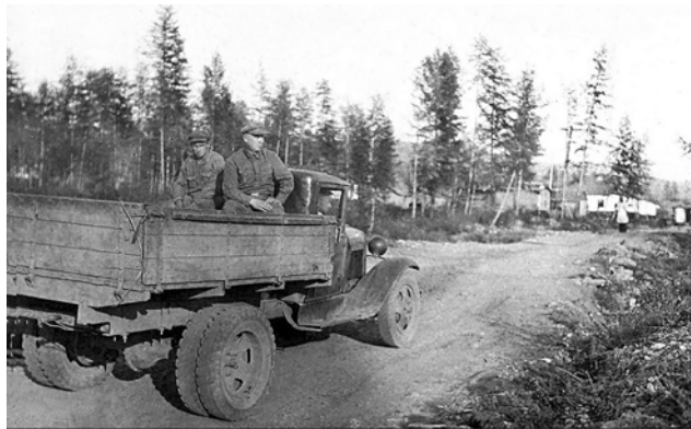
Дорога на Беличью. 1944 г.

Примечательно, что новый главный врач не увидел в Беличье «колючки», то есть, территории, обнесенной