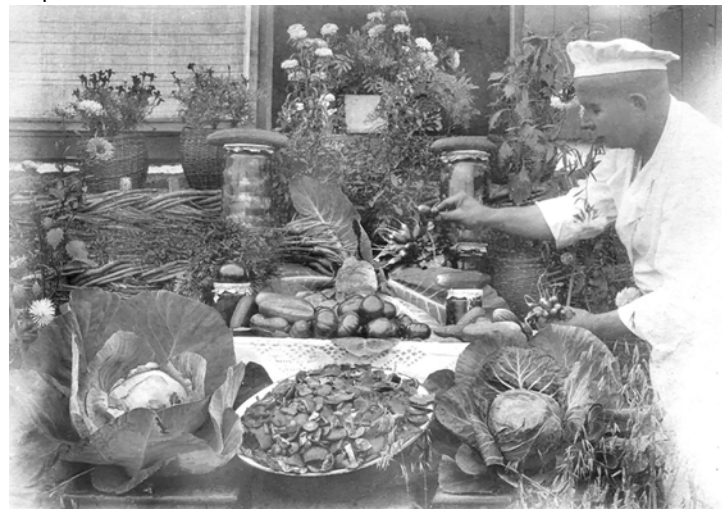
Повар столовой в больнице на Беличье