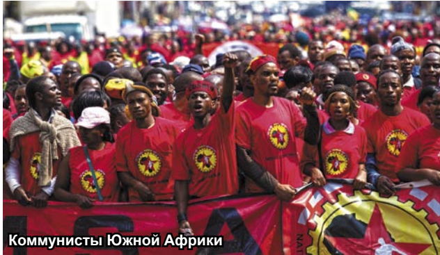
Коммунисты Южной Африки

«Вторжение России в Украину... было неправильным и нарушало международное право. По словам Национального совета КП США, «война между государствами никогда не является приемлемым решением и должна быть отвергнута самым решительным образом». Рабочий класс обеих стран заслуживает поддержки и солидарности, как и растущие там движения за мир. Недавно один миллион подписал петицию о мире в России. Это огромная цифра! Но давайте прямо расставим