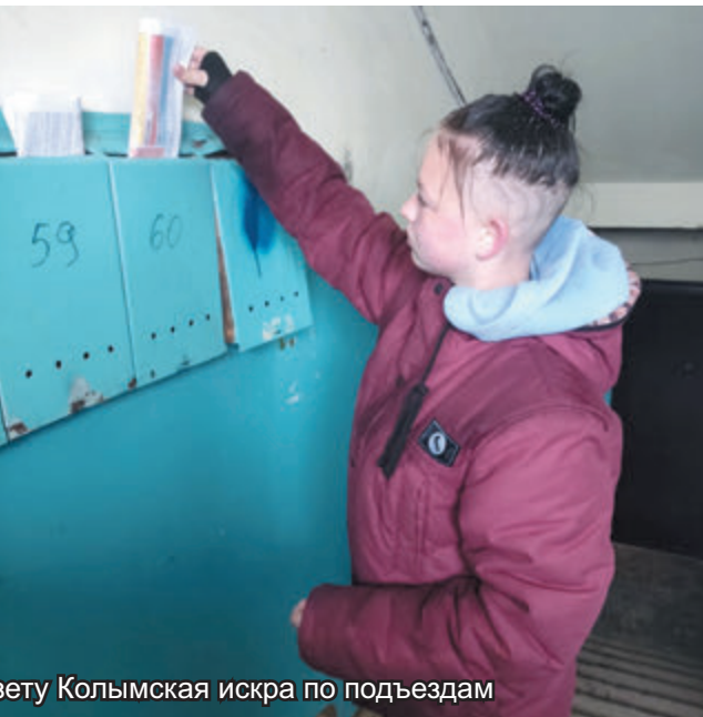
Будущие комсомольцы поселка Сокол разносят газету Колымская искра по подъездам