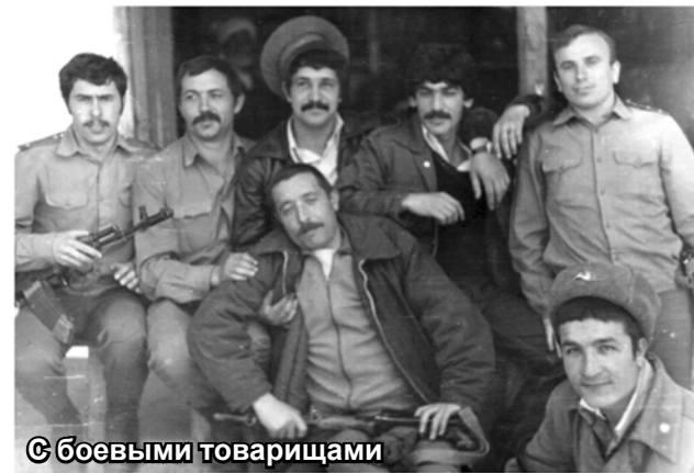
С боевыми товарищами

– Возьмешь такого за руку, повернешь его и толкнешь, он сам идет в заданную сторону, не рассуждая. У некоторых в таком состоянии пропадал даже инстинкт самосохранения.