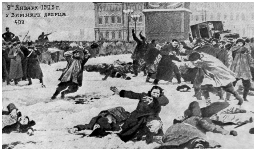
9-е Января 1905 г. у Зимнего дворца. 409.