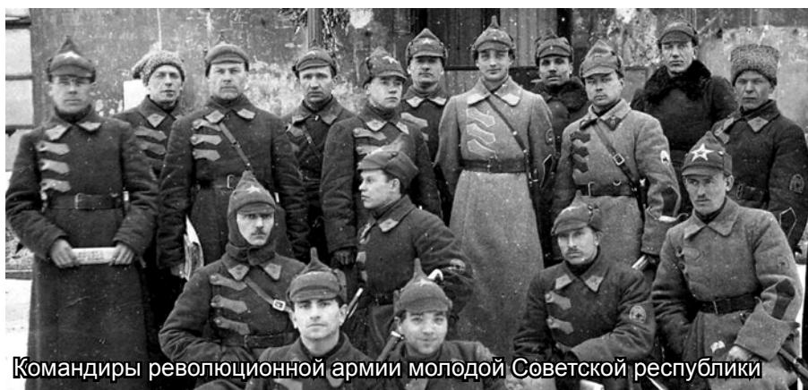
Командиры революционной армии молодой Советской республики

Итак, подытоживая исторический экскурс в