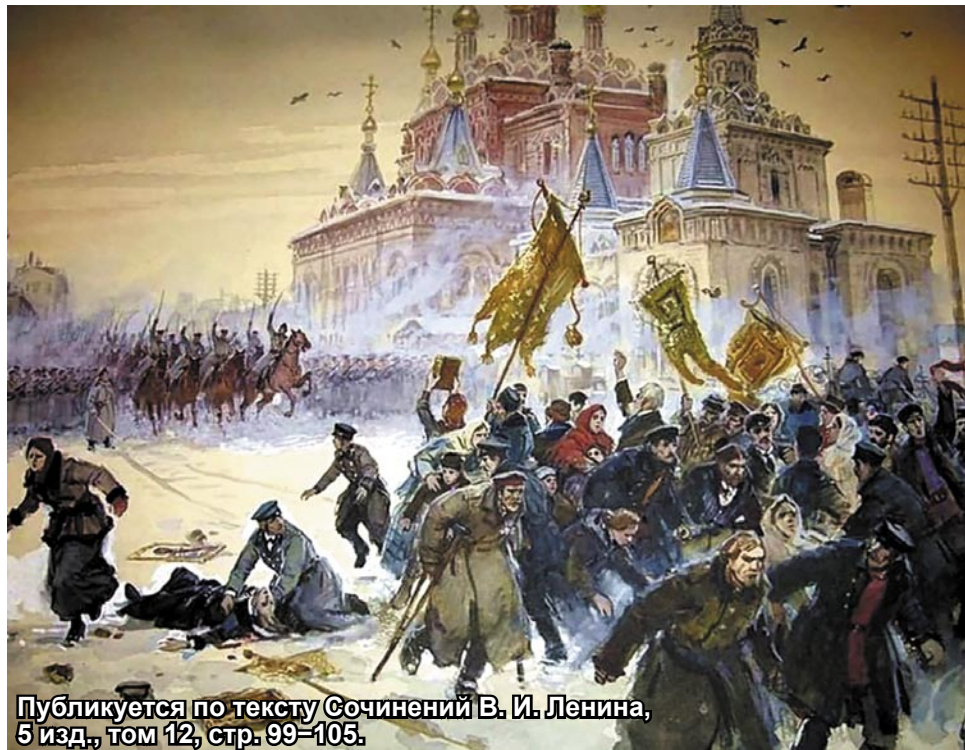
Публикуется по тексту Сочинений В. И. Ленина, 5 изд., том 12, стр. 99-105.

Жить в обществе и быть свободным от общества нельзя.