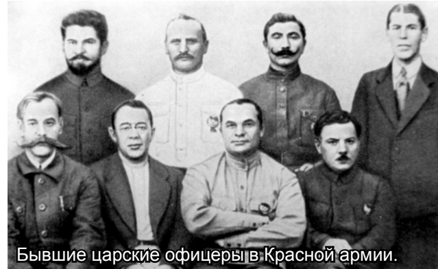
Бывшие царские офицеры в Красной армии.

роду, как к своим единокровным единоверцам, но уже с начала-середины восемнадцатого столетия аристократия в России, лучше владевшая немецким, потом французским и английским языками, во всем подражавшая Европе и стремившаяся пере-